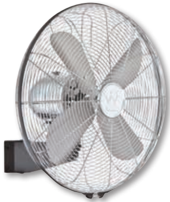
Variante zur Wandmontage

1 VENTILATOR = 3 INSTALLATIONSMÖGLICHKEITEN