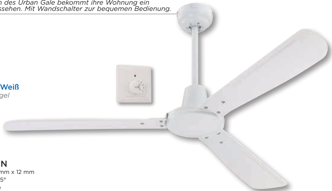
72021 132 cm Ausführung in Weiß Weiße ABS Kunststoffflügel

Mit der modernen Version des Urban Gale bekommt ihre Wohnung ein frisches, zeitgemäßes Aussehen. Mit Wandschalter zur bequemen Bedienung.