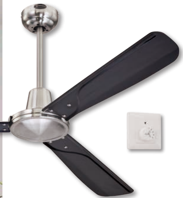
72020 132 cm Ausführung in gebürstetem Nickel Schwarze ABS Kunststoffflügel